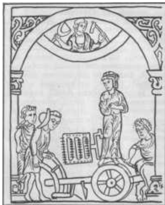
Крестьянин с плугом. Плуг с отвалом. XII в.